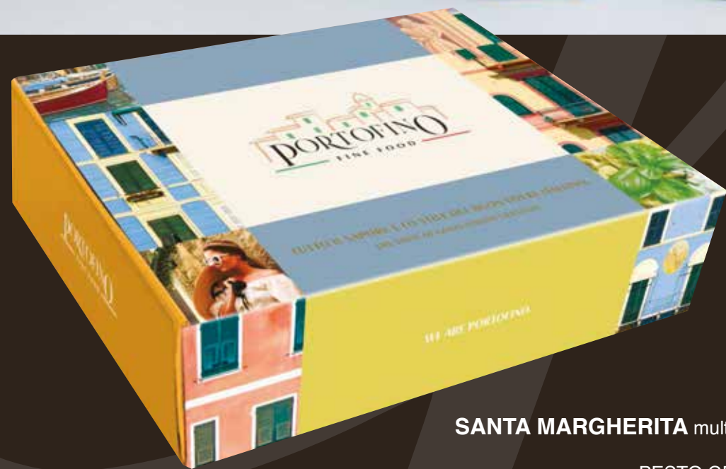
SANTA MARGHERITA multipli di 4 pz € 48,70 cad.