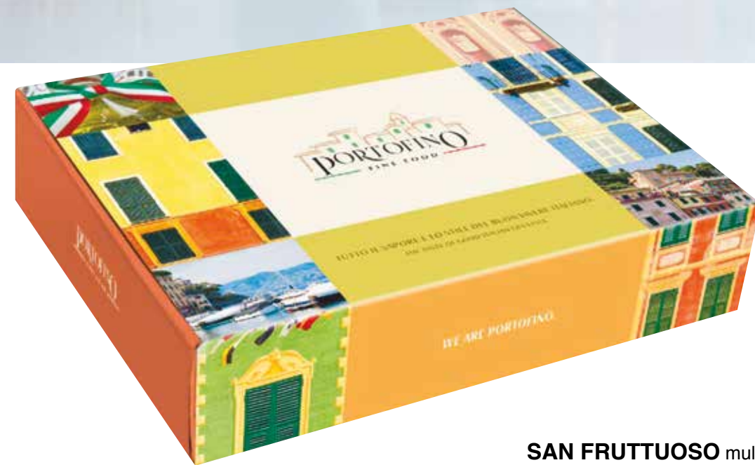
SAN FRUTTUOSO multipli di 2 pz € 74,25 cad.